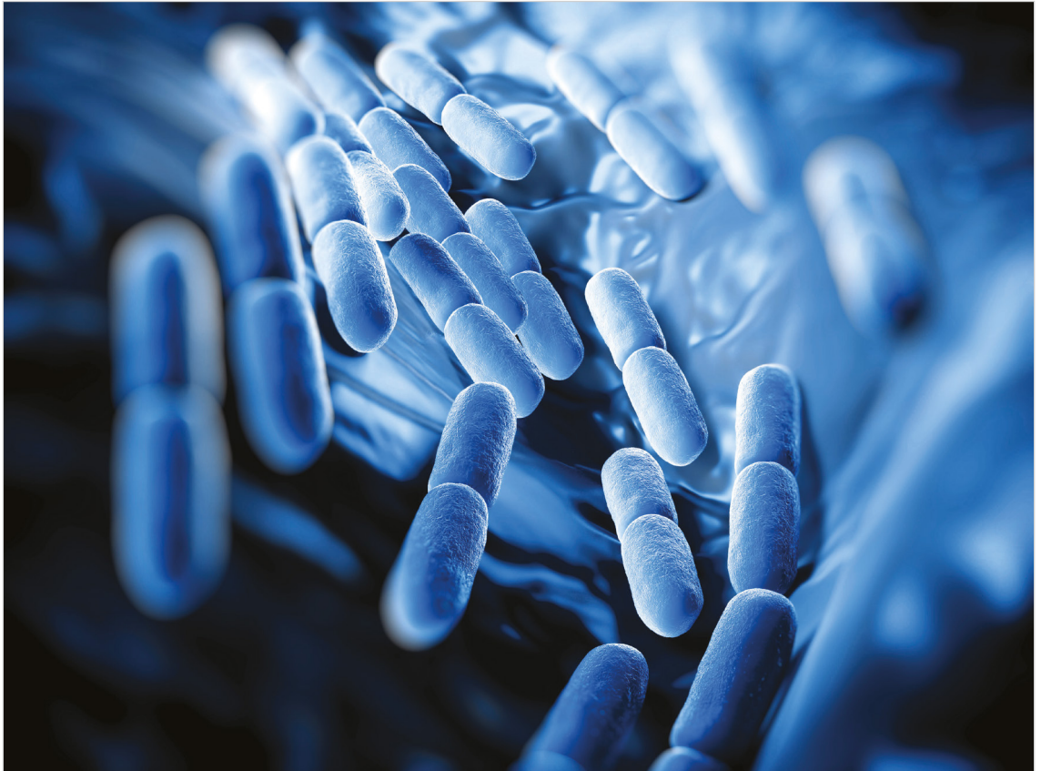
Figura 1. Lactocaseibacillus paracasei Shirota (LcS).